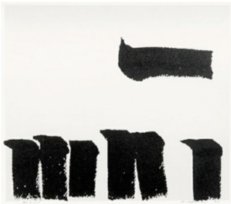
Ufan Lee (1936- ) from brush 36.5x46cm Silkscreen Ed.100 1982